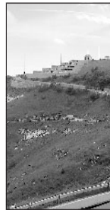
MONTE GRAPPA Gita col Gerv

organizzatori suggeriscono due facili escursioni. La prima, da fare in autonomia, è la classica salita con partenza da valle Santa Felicità di Romano d'Ezzelino. La seconda, con partenza alle 9,30 dalla malga, è nuovo percorso escursionistico, semplice e alla portata di tutti, con il «Ciak» che farà da guida alla scoperta di luoghi storici recentemente recuperati. Il tempo complessivo di percorrenza è di circa due ore. Per partecipare alla festa è obbligatorio iscriversi. La quota di partecipazione è di dodici euro; sette euro per bambini e ragazzi dai 6 anni a 14 anni. Sono molto graditi dolci fatti in casa. Informazioni presso la sede Gerv nell'ex municipio.