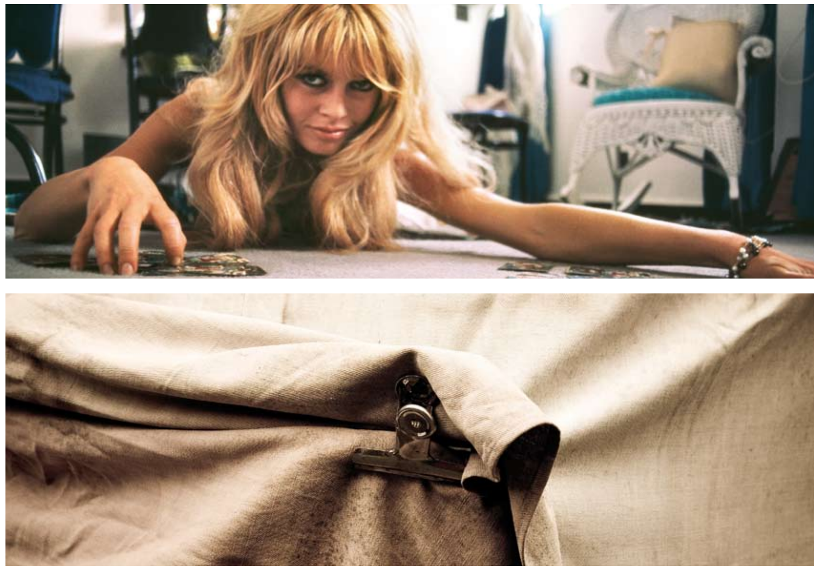
Allegato al giornale della Pro Bassano - registro periodici del Tribunale di Bassano N. 1097